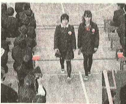
拍手のなか堂々と退場です