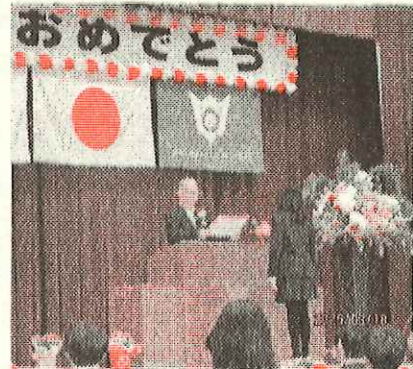
卒業 証書授与もキリリと