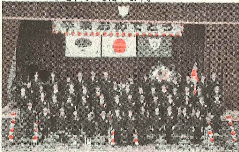
6年生によるよびかけ～変わらないもの～

3月18日(火)。寒の戻りもあり一段と冷え込んだ朝からの快晴のもと、水戸小学校第48回卒業式が、4、5年生の参加、保護者のみなさま、そして、来賓のみなさまのご列席のなかで、盛大に挙行することができました。一週間以上も前から始まった卒業式練習でしたが、全体を通して、6年生の子どもたちの練習への取組姿勢は立派で素晴らしく、式前日のリハーサルはもちろん、式当日の6年生の背中では、4、5年生の水戸っ子たちに最高学年、そして、巣立ちゆくものとしての在り方を示してくれるものでした。呼びかけや「変わらないもの」の歌声も抜群でした。素晴らしいお手本を示してくれた6年生に大きな拍手とこれからへのエールを送りたいと思います。