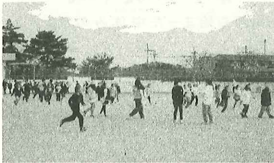
元気いっぱい運動場を走っています！