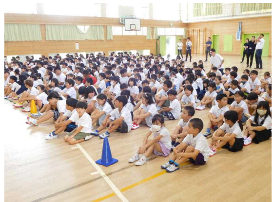
お話を聞く姿勢もバッチリです!

9月1日、2学期始業式でした。早朝から体育館の窓を全開にして、熱中症の対策をし全員集合での始業式でした。お話を聞く姿勢も素晴らしく、2学期スタートから頑張る水戸っ子たちでした。また、夏休み明けの生活について高学年部の先生方から劇を交えてのお話がありましたが、楽しく分かりやすいものでした。早寝、早起き、朝ごはん。生活リズムを整えて2学期をスタートしてください。