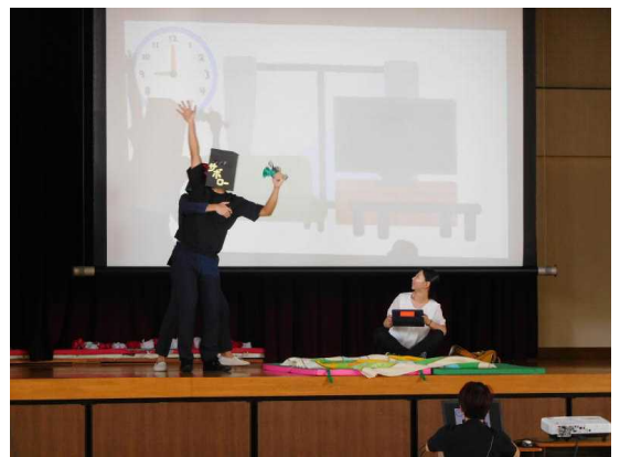
楽しい劇を交えてのお話でした

さて、今年の夏もグラウンドの草抜きをしてみました。今年は徒競走のコースとトラックをきれいに除草しようという目標にしました。2学期が始まって間もなく、運動場で草を抜いていると、体育の授業に出てきた6年生の水戸っ子たちが、「校長先生、ありがとうございます」と大きな声で声をかけてくれました。『ありがとうと言ってくれてこちらこそありがとうございます』という気持ちです。リーダーの6年生がこうですから、水戸っ子たちが素敵になります。『嵐』に合わせて手拍子してくれる子どもたちを見て、2学期も頑張ろうと思いました。(山田)