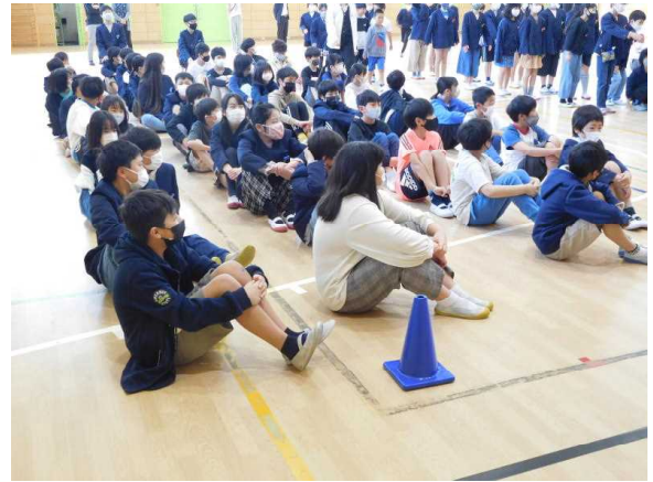
全校のトップで入場した6年生の待つ姿勢が素晴らしいお手本でした！

5月の全校集会で、「すきな学校」に『て』をいれて「すてきな学校」にしていきましょう。というお話をしました。キーワードは「てをいれる」です。この言葉を調べてみると、手を加える。よい状態にするために補ったり、直したりする。などの意味があります。「すきな学校」に『て』をいれると「すてきな学校」なります。水戸小学校を、さらにすてきな校にパワーアップしたいです。みなさんは、どんなふうに『て』をいれますか。例えば、☆朝、帰り元気に挨拶する☆靴箱のくつを整える☆トイレのスリッパを揃える☆困っている人がいたら声をかける、助けてあげる、いろいろありますね。水戸小学校が、すきな学校からさらに、パワーアップして、すてきな学校になるように、みんなでトライしていきましょう！