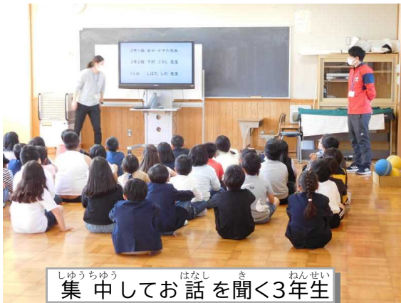
集中してお話を聞く3年生

学年のスタートにあたり、多くの学年で学年集会がもたれています。そこで、校長先生からのお話ということで、それぞれの学年に向けてのお話をしました。水戸っ子たちの目はやる気に満ちていて、どの学年も、話す先生方をしっかりと見て、姿勢も正しく集中して話を聞くことができている集会でした。昨年からの成長を実感しました。子どもたちってすごいです。スタートの気持ちを大切に、ますます伸びていってほしいです。