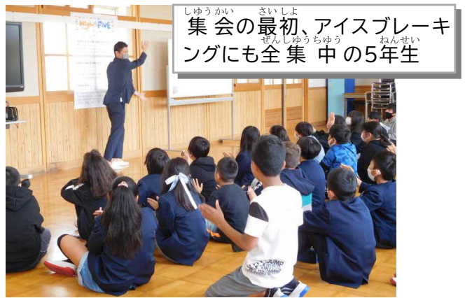
集会の最初、アイスブレイキングにも全集中の5年生