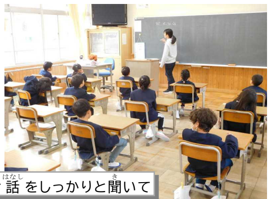
1年生 先生のお話をしっかりと聞いて

4月11日(火)からの3日間は、1年生は3時間で下校していました。1年生は、45分間の授業時間や学習の習慣を習得していくところからのスタートです。先生のお話をしっかりと聞いて、たくさん学びを積み上げていってほしいと思います。一日一日の積み重ねが大きな力となっていきます。