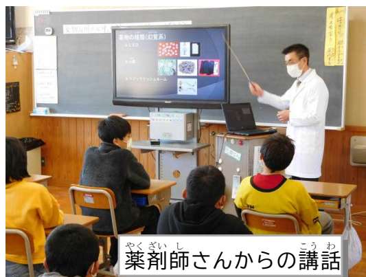
薬剤師さんからの講話

青少年期はたばこ、アルコール、さらには依存性薬物を使用するきっかけが起りやすい時期であり、また、心身の発育・発達段階にあるため、依存状態に陥ると人格の形成が妨げられることなど、薬物の影響が深刻な形で現れることがあることから、学校における薬物乱用防止に関する指導がとても重要です。水戸小学校では、6年生が12月9日(金)に学校薬剤師さん、甲賀警察署さん、補導委員さん、少年センターさんをお招きして学習を行いました。真剣にお話を聞くことができました。また、薬物への勧誘を断るロールプレイも実施していただきました。入口はたくさんあっても出口のない薬物乱用の有害性や危険性について学ぶことができました。