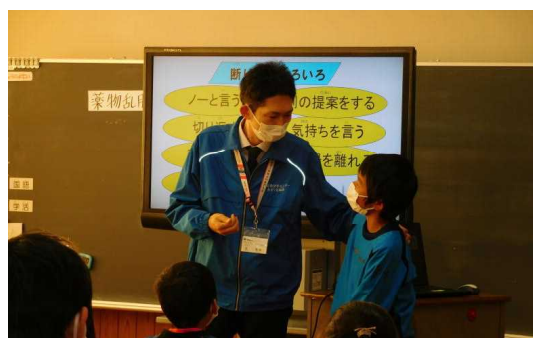
少年センターの先生とのロールプレイ