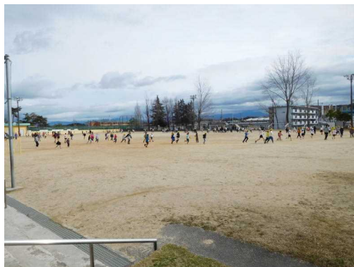
運動場のトラックを走っています