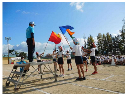
各色からの工夫を凝らしたスローガン宣言