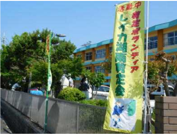
美しく剪定されています

玄関前や運動場脇の庭木を「レイカ湖南剪定会」のみなさまに剪定ボランティアとしてきれいに剪定していただきました。当日は、気温も高い中でしたが、作業していただきました。美しく整った環境は子どもたちの学習環境としてとても大切なことです。ありがとうございました。