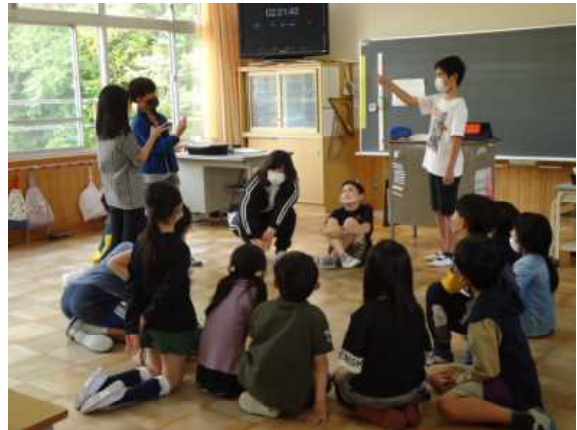
縦割りでゲームをしています