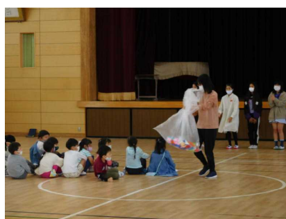
6年生から1年生に プレゼント