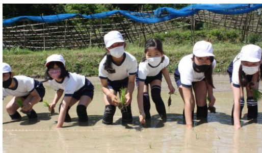
農作業の楽しさと大変さを味わいました

さくねん がつ りん じきゆうぎよう きかんちゆう こ 昨年の5月は、臨時休業期間中ということで子どもたちが田植えを体験することはできませんでした。