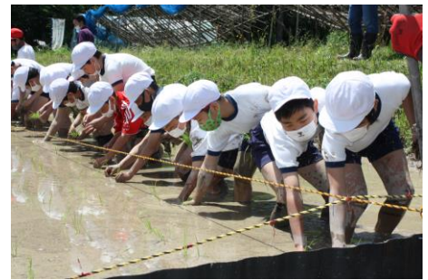
1列に並んで、まっすぐに植えました

そんななか、本校も5月6日に5年生が田植えを実施しました。田んぼに到着し説明を聞いた後、早速、水が張られた田に足を踏み入れました。冷たさと独特の感触に歓声とも悲鳴ともいえる声をあげる子どもたち。膝近くまで沈みこむところもあり、歩くのにも苦勞していました。そして、手渡された苗を決められた場所に丁寧に植えていきます。最初は、戸惑っていた子どもたちもだんだんと慣れてきて、テンポよく植えることができるようになりました。合図に合わせて、一斉に苗を植える姿に、子どもたちの成長を感じた瞬間でした。