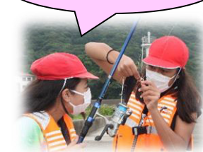
釣りざおを持って、さあ乗船!