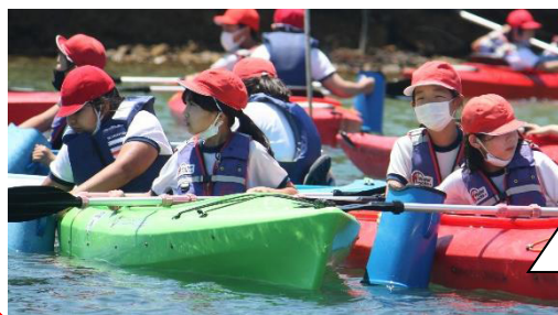
潮風を感じながら ひと休み