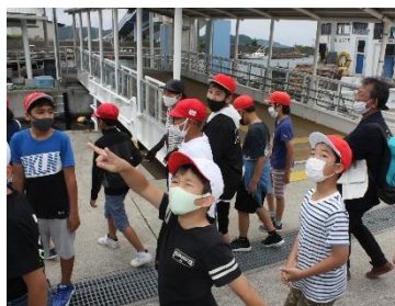
からまっちゃった!