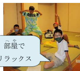
部屋で リラックス