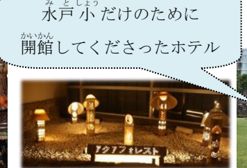
みとしょう 水戸小だけのために 開館してくださったホテル