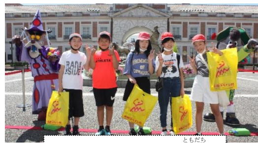
キャラクターたちもお友達