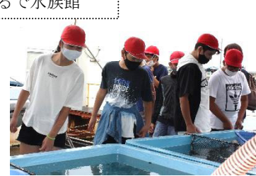
漁港はまるで水族館