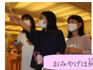
おみやげは何がいいかな…