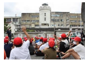
菅島小学校とミニ交流