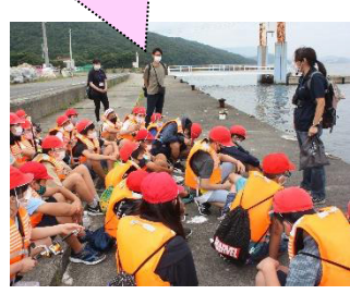
船に乗って 菅島へ