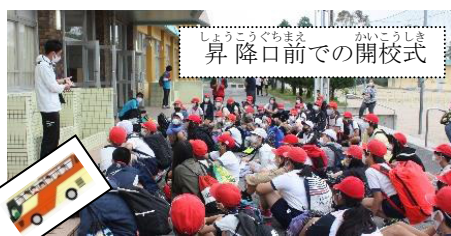
昇降口前での開校式

6月17日・18日に6年生が修学旅行に行きました。実施に当たっては、保護者の皆さまには様々な形でご相談させていただきましたが、多くの方々のご協力のもと実施できたことに感謝の気持ちでいっぱいです。 子どもたちにとって、楽しいだけでなく学びの多い修学旅行になりました。