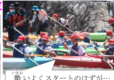
勢いよくスタートのはずが…