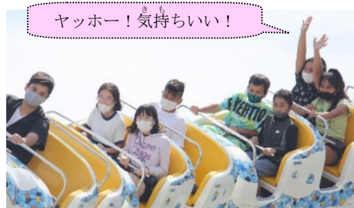
ヤッホー！気持ちいい！