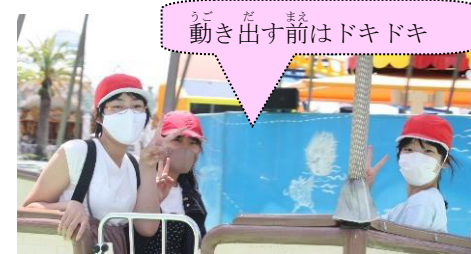
動き出す前はドキドキ