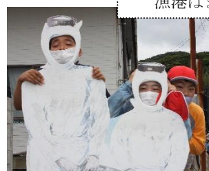
最後の活動は島内散策