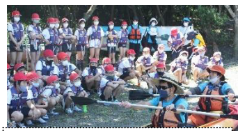
シーカヤックは しっかり説明を聞いて