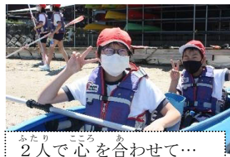
ふたり 2人で心を合わせて…