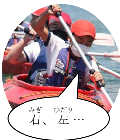
みぎ ひだり 右、左…