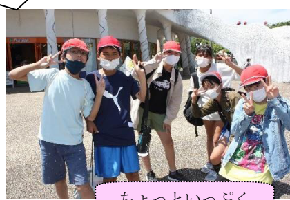
ちよっといっつく