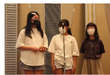
おひろま 大広間での食事